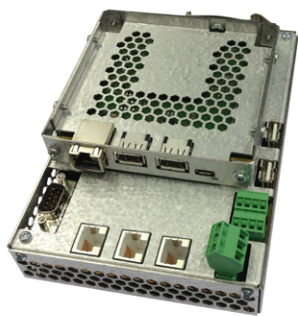
Intel Atom E3800